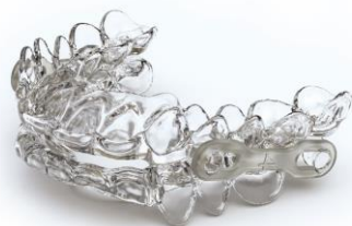
Fig. 1 : OPTISLEEP - plus de confort de port pour le patient grâce à son design extra-mince