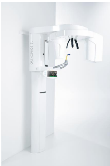
Fig. 5 : Les prises de vue 3D pour l'analyse des voies respiratoires et la planification des thérapies avec gouttière peuvent être réalisées avec l'Orthophos SL.