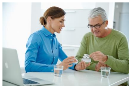
Fig. 4 : La gouttière de thérapie adaptée et fine OPTISLEEP de SICAT garantit un haut confort de port avec une meilleure coopération des patients.