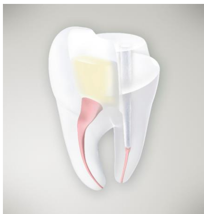
Fig. 5 : Avec la solution « R2C™ », les produits d'endodontie et de restauration s'associent pour offrir une solution complète.