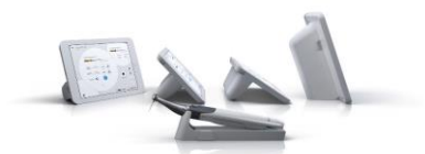
Fig. 1 : X-Smart IQ : moteur sans fil à mouvement continu et réciproque, piloté grâce à une application Apple iOS.