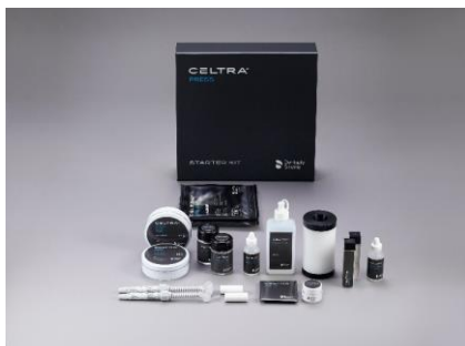
Fig. 3: Il nuovo silicato di litio rinforzato con ossido di zirconio pressabile Celtra Press, oltre alla relativa ceramica da rivestimento Celtra Ceram e alla massa di rivestimento Celtra Press Investment sono immediatamente disponibili.