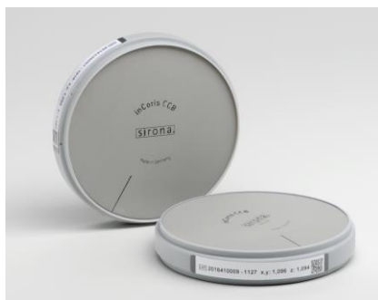
Fig. 2: I dischi in metallo sinterizzato inCoris CCB di Dentsply Sirona sono disponibili come dischi standard (Ø 98,5 mm) in sei diverse altezze.