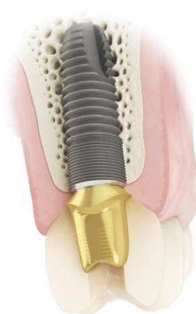
Fig. 4: La nuova soluzione CustomBase di Atlantis combina un abutment Atlantis con una corona Atlantis per restauri di denti singoli avvitati.