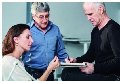
Fig. 6: La pasión por innovar a través del equipo con nuestros expertos en Endo: Compañeros para un futuro mejor.